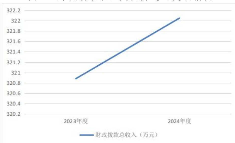
图 4: 财政拨款收、支决算总计变动情况

2024 年度财政拨款收入中,一般公共预算财政拨款收入 322.05 万元,比 2023 年度决算数增加 19.17 万元。增加主要原因是一般公共服务收入增加。政府性基金预算财政拨款收入 0 万元,与 2023 年度决算数 0 万元相比金额不变,主要原因是本单位当年无政府性基金财政拨款。国有资本经营预算财政拨款收入 0 万元,比 2023 年度决算数 0 万元相比金额不变,主要原因是本单位当年无国有资本经营财政拨款。