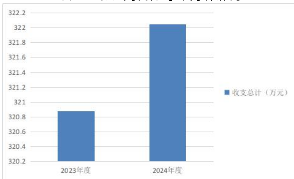
图 1：收、支决算总计变动情况

2024 年度收、支总计均为 322.05 万元。与 2023 年度相比，收、支总计各增加 19.17 万元，增长 6.3%，主要原因是一般公共服务收入支出增加。